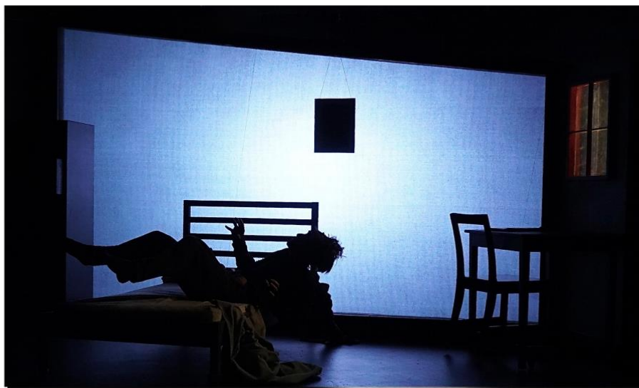
La claustrophobie règne dans l'univers étroit de Grégoire Samsa, devenu un insecte répugnant et géant.

Les préoccupations essentielles de Grégoire Samsa, au départ de cette «mésaventure» comme l'écrivit Kafka, c'est son travail: il va arriver en retard, son patron va le congédier, il ne pourra plus